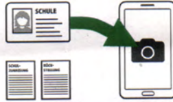
Passfoto und Foto Schülerausweis hochladen