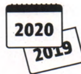
Ticket gilt 4 Jahre bis zum 16. Geburts- tag, danach immer 1 Jahr