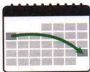
Ticket (VBB-fahrcard) wird innerhalb von 3 Wochen zugesandt